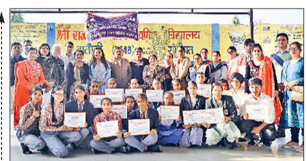
गन्नीर। बाल वैज्ञानिक प्रदर्शनी के विजेताओं के साथ स्कूल स्टाफ।