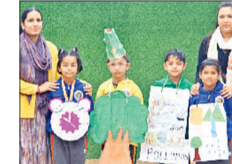
गन्नीर। कविता वाचन के प्रतिभागी छात्रों के साथ बाल भवन इंटरनेशनल स्कूल का स्टाफ।