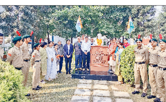
छोटूराम आर्य महाविद्यालय में चौ. छोटूराम को नमन करते हुए प्राचार्य एवं अन्य।

श्रद्धासुमन अर्पित कर की गई। प्राचार्य ने चौधरी छोटू राम के उत्कृष्ट योगदान को याद करते हुए कहा कि उन्होंने किसानों और श्रमिकों के अधिकारों के लिए महत्वपूर्ण कार्य किए। उन्होंने विद्यार्थियों को उनके जीवन से प्रेरणा लेने, उनके आदर्शों को अपनाने और समाजहित में आगे बढ़कर कार्य करने का संदेश दिया। एनसीसी कैडेटों ने भी चौधरी छोटू राम को सलामी देकर उनके प्रति सम्मान व्यक्त किया।