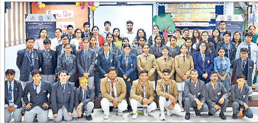
ब्राइट स्कॉलर स्कूल में प्रतिभागियों के साथ अतिथिगण साथ में प्राचार्या एवं अन्य।