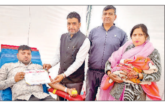
गोहाना। शिविर में रक्तदाताओं को प्रोत्साहित करते हुए अतिथि।