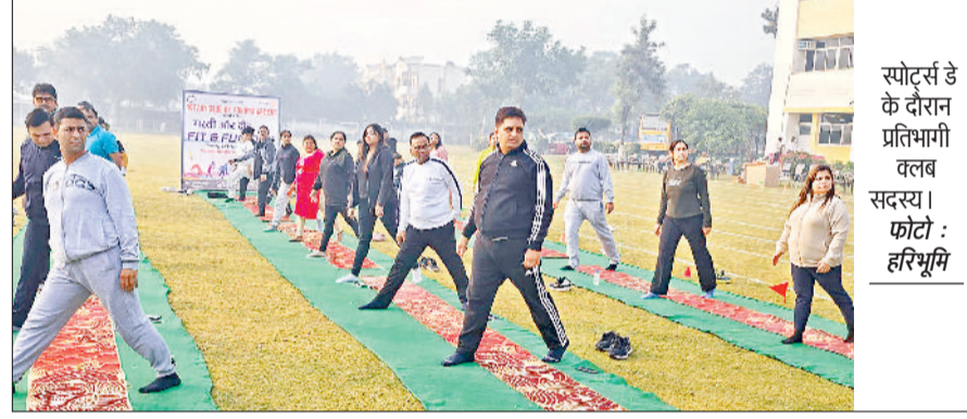
स्पोर्ट्स डे के दौरान प्रतिभागी क्लब सदस्य।