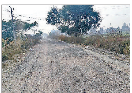
गन्नाौर। अधूरा पड़ा भिगान-कामी सड़क निर्माण कार्य।

गन्नाौर। भिगान से कामी जाने वाली सड़क को उखाड़कर अधूरा छोड़ देने से ग्रामीणों में रोष व्याप्त है। लोक निर्माण विभाग द्वारा समय पर निर्माण कार्य पूरा न किए जाने के कारण राहगीरों को गंभीर समस्याओं का सामना करना पड़ रहा है। ग्रामीणों के अनुसार सड़क के उखड़े हिस्से और गड्ढों से भरी पट्टी पर चलना बेहद मुश्किल हो गया है, जिससे हर दिन दुर्घटना का खतरा बढ़ रहा है। सड़क उखड़ने के बाद उठ रही धूल लोगों के लिए नई मुसीबत बन गई है। आसपास के घरों में धूल भर रही है और राहगीरों की आंखों व सांस पर बुरा असर पड़ रहा है। जबकि ग्रैप नियम लागू है। ग्रामीणों का आरोप है कि विभाग की ओर से सड़क पर पानी का छिड़काव तक नहीं किया जा रहा, जिससे हालात और बिगड़ते जा रहे हैं।