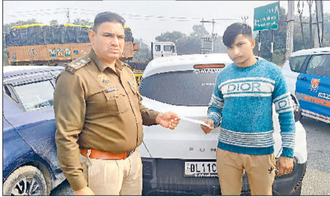
सोनीपत। अभियान के दौरान चालान काटते हुए पुलिस कर्मी।