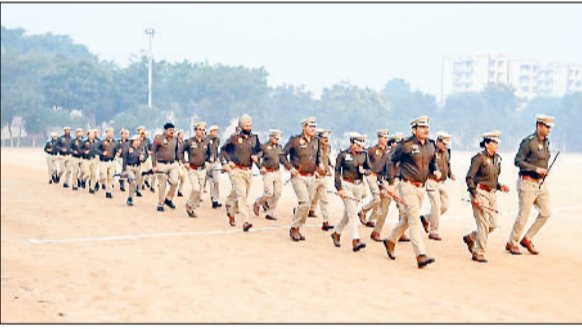
सोनीपत। परेड के दौरान शामिल पुलिस कर्मी।