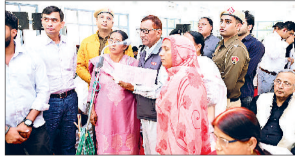
सोनीपत। बैठक के दौरान शिकायतकर्ता अपनी बात रखते हुए।