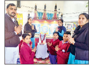
गोहाना। गुरु तेग बहादुर का स्मरण करते हुए गुरु और शिष्य।