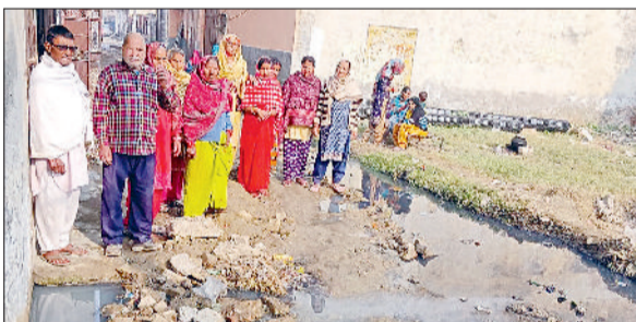
सोनीपत। गली की स्थिति दिखाकर विरोध प्रदर्शन करते स्थानीय निवासी।