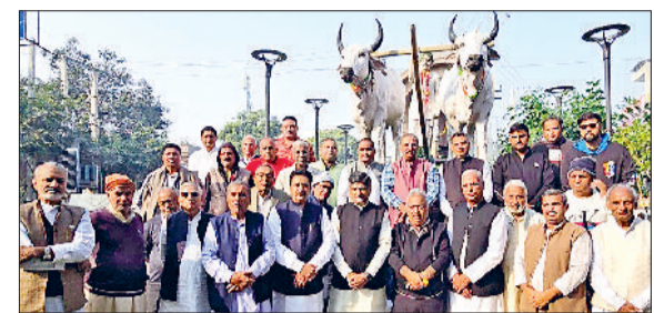
गोहाना। दीनबन्धु छोटूराम की प्रतिमा पर माल्यार्पण करते नागरिक।